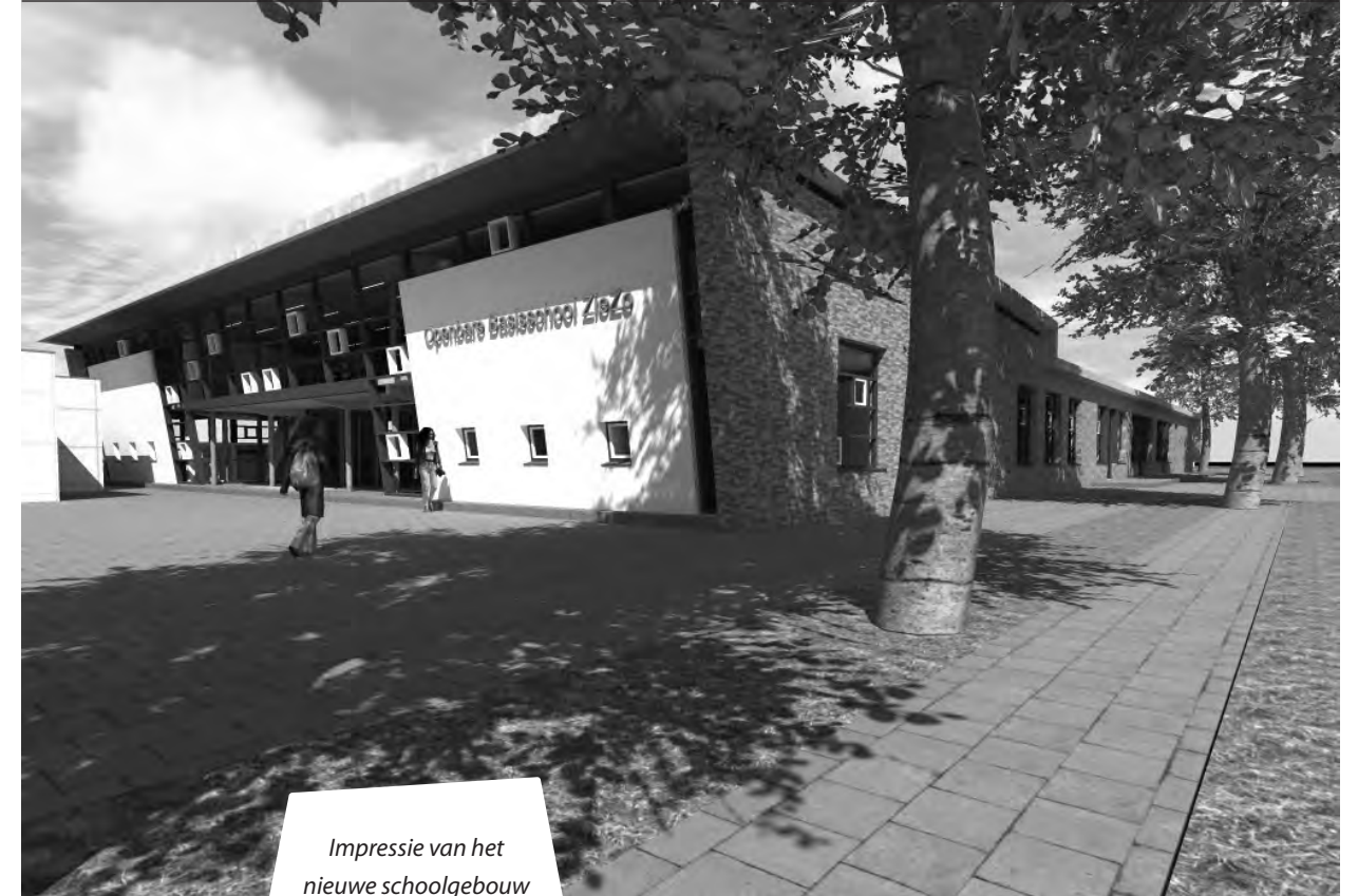
Impressie van het nieuwe schoolgebouw

Wij spreken heel bewust over bouwgroepen omdat we kinderen de kans willen geven binnen een bouw (twee jaargangen) volledig tot ontwikkeling te komen.